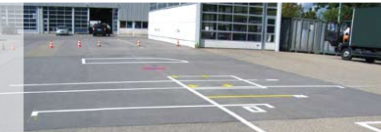
Pilotanbringung bei der Mercedes Benz Niederlassung in Böblingen-Hulb.

Die langjährige Erfahrung in den Bereichen Vorschriften, Unfallforschung sowie der Aus- und Weiterbildung von Kraftfahrern veranlasste MAN, Mercedes und DEKRA dazu, diese Orientierungshilfe zur richtigen Einstellung der Spiegelsysteme zu entwickeln und zu perfektionieren.